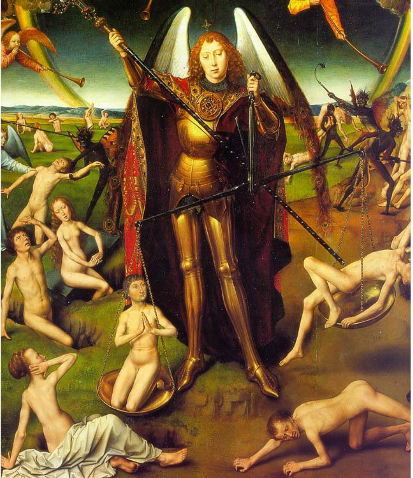
Yttersta Domen , 1472 Hans Memling (c:a 1433 - 1494). När Ärkeängeln Mikael väger de uppståndna har Sankta Bantista en anspråklös roll på hans högra sida.

Det finns en rad legender om underverk gjorda i Sankta Bantistas namn. De verkar obegripliga för en modern svensk. Lättare att förstå är Bantista-hymnen, som lånat sin melodi till Lucia-sången. Den sjungs dagligen av bantister i hela världen. I boken finns den översatt till elva